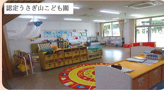
認定うさぎ山こども園

中学校までの医療費の無料化実現に努めます。誰もが等しく学べる環境づくりや魅力ある県立高校の再生整備と私立高校の運営支援など教育の町づくりを推進します。