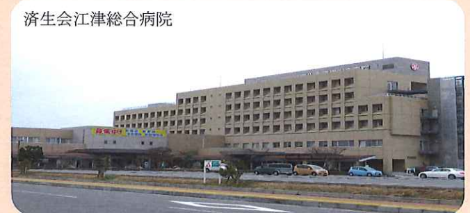
済生会江津総合病院

高齢者や障がい者福祉の充実は暮らしの安心です。更に、若者定住には地域医療体制の安定と充実が必要です。中核病院の済生会総合病院の機能充実と医師・看護師不足を解消するために経営支援などを国・県に働きかけます